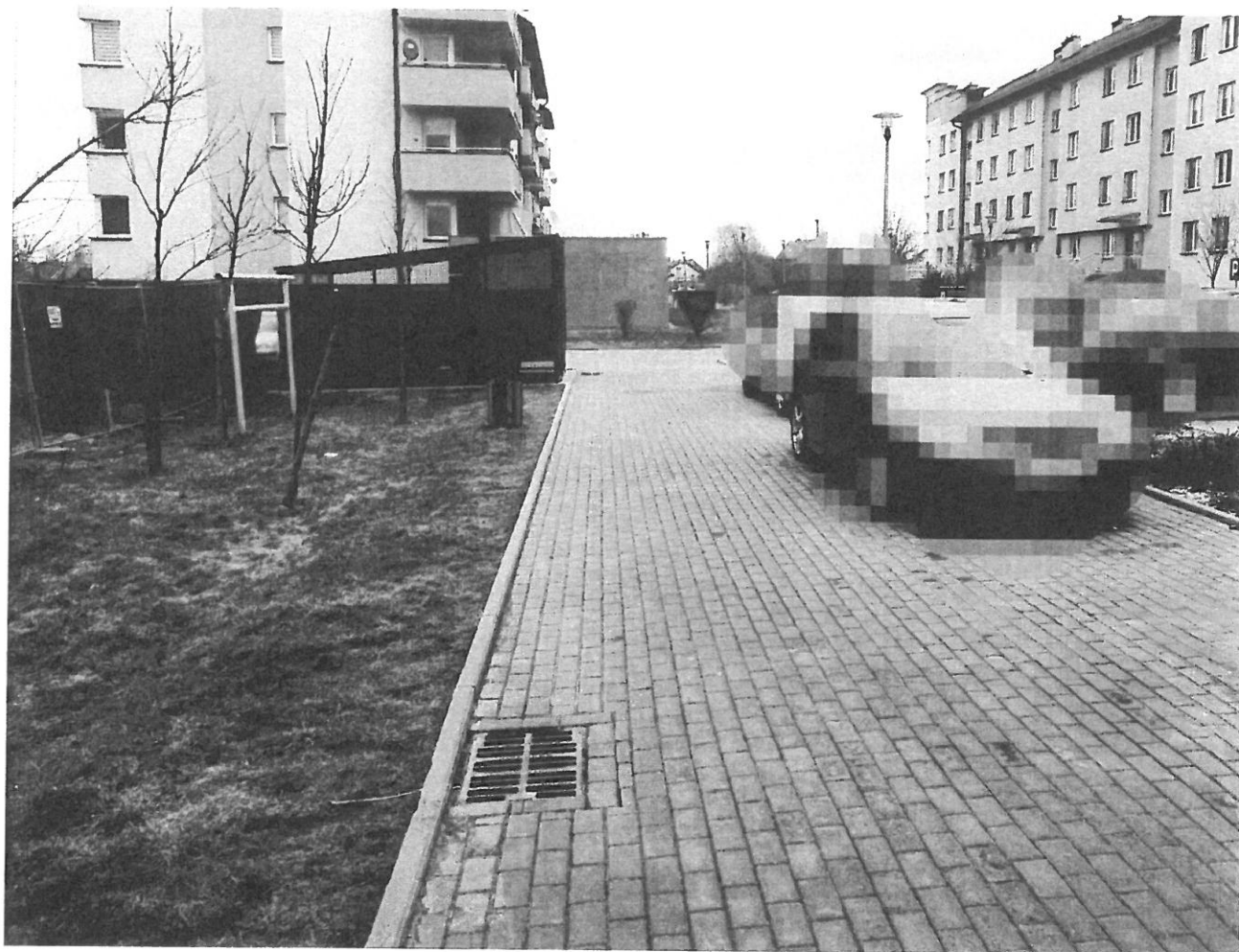
— PARKINKI (8).jpg —