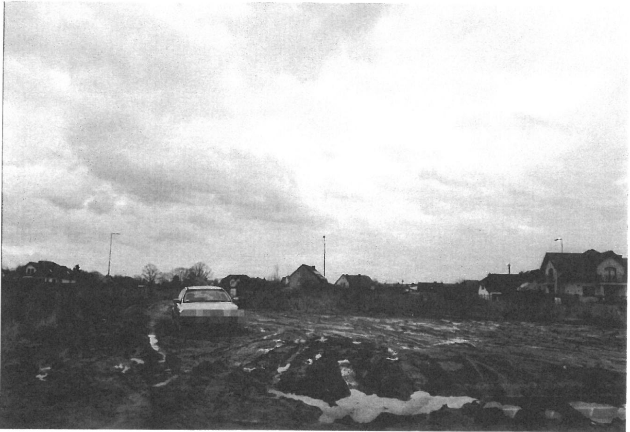
— PARKINKI (2).jpg —