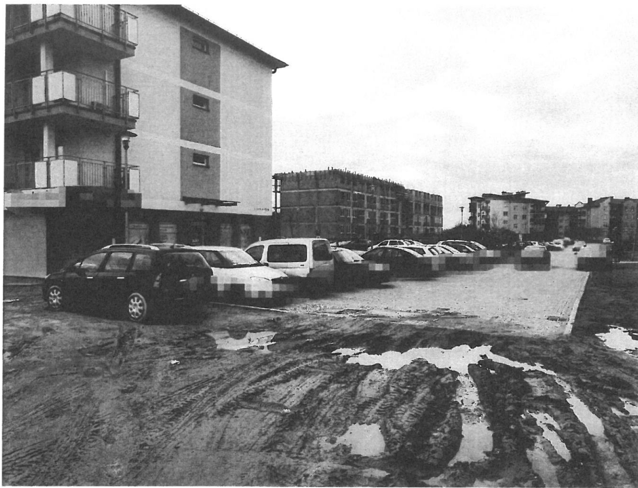
— PARKINKI (5).jpg —