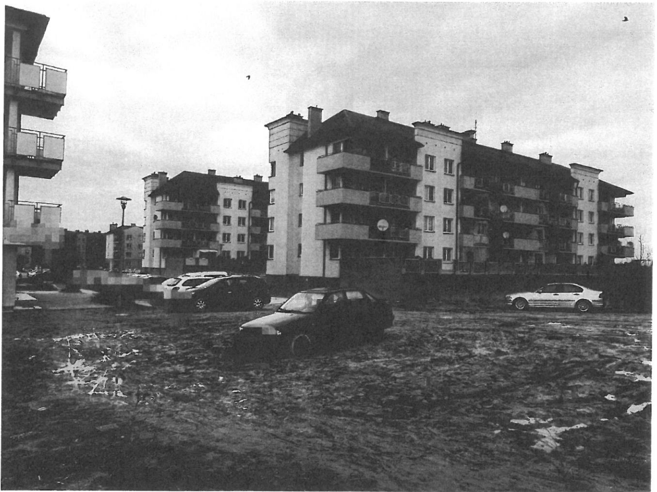
— PARKINKI (3).jpg —