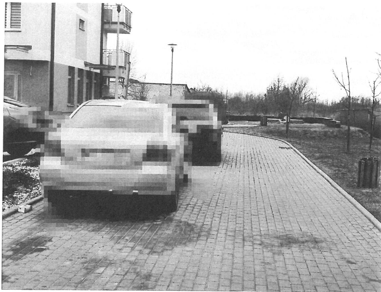
— PARKINKI (7).jpg —