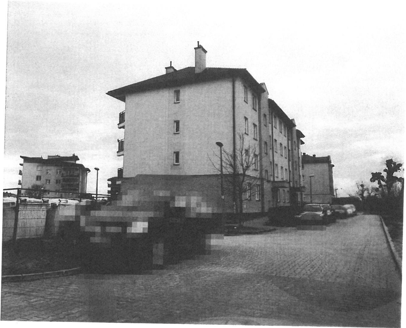
— PARKINKI (9).jpg —