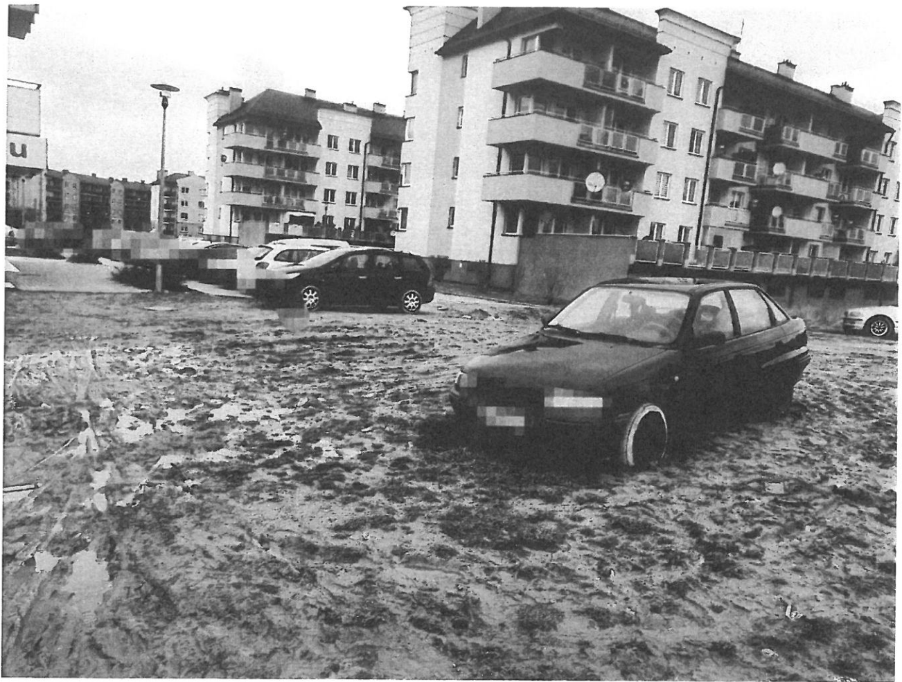
— PARKINKI (4).jpg —