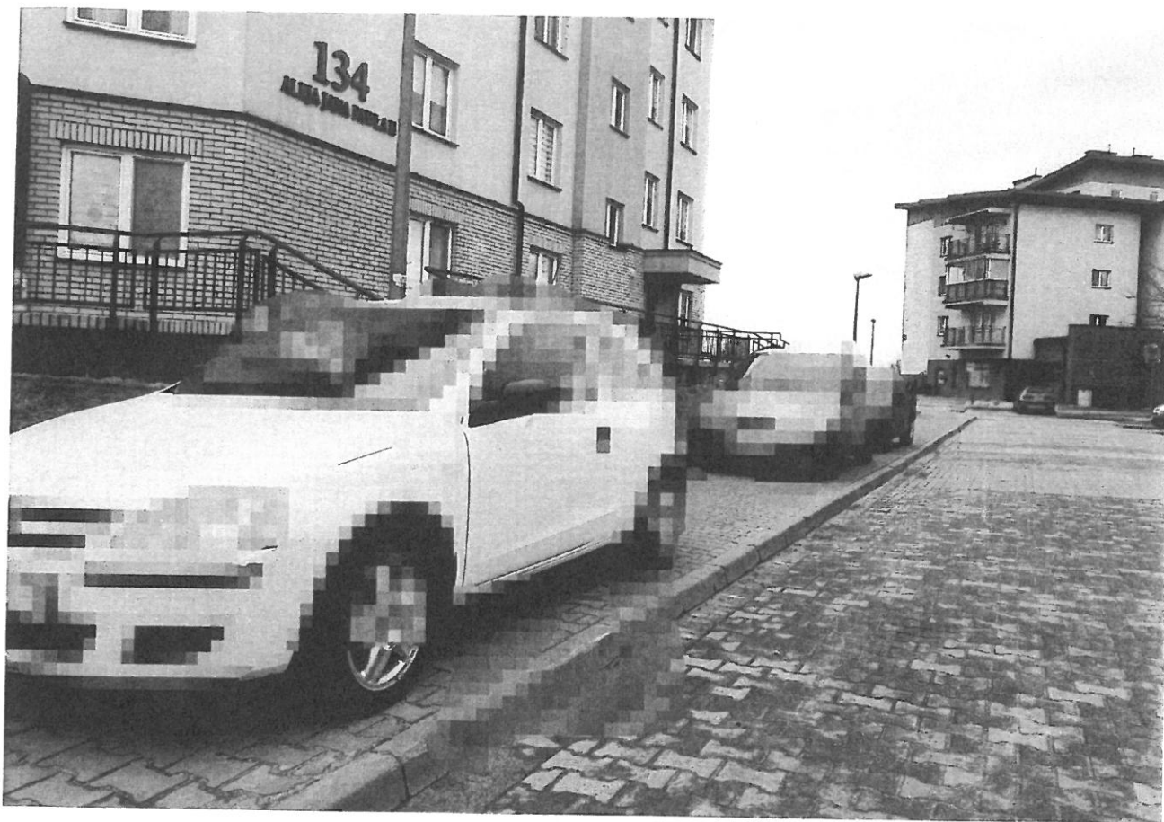
— PARKINKI (10).jpg —