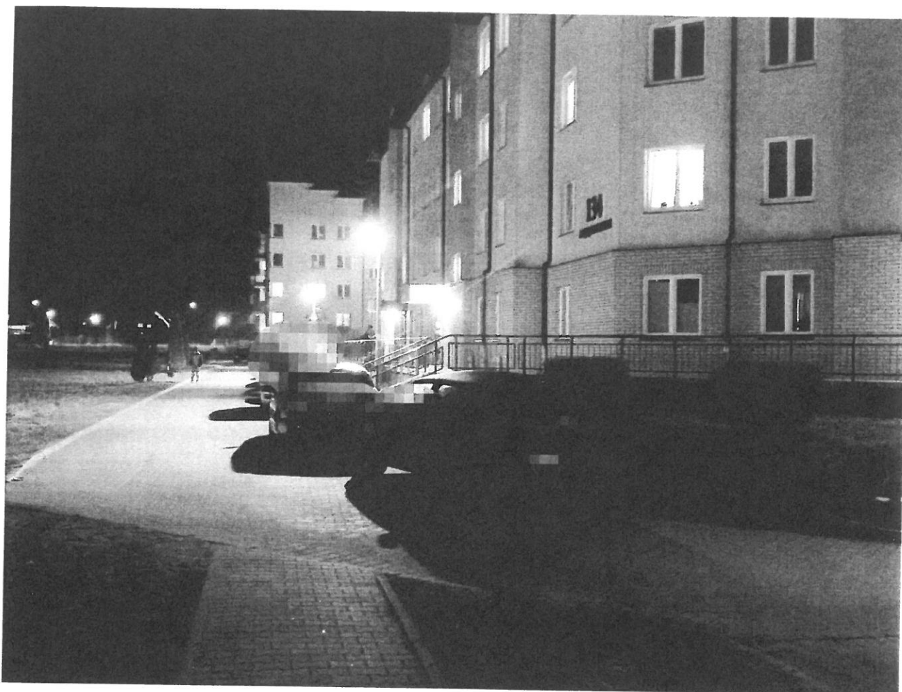
— PARKINKI (12).jpg —