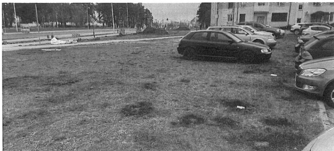
(zdjęcie z 26.04.2022r.)