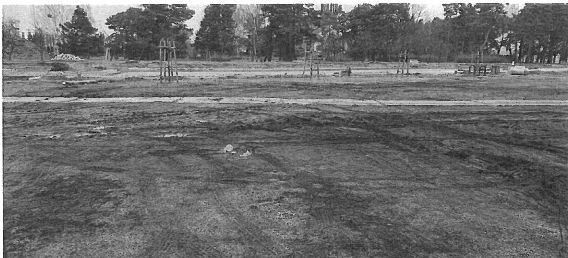
(zdjęcie z 26.02.2022r.)

Z parkingu korzystają mieszkańcy domów jednorodzinnych z ulic: Ks. Skierkowskiego, Stanisława Barzykowskiego, bloku przy ul. Brata Żebrowskiego 4, bloku przy ul. Skierkowskiego 18 oraz pracownicy i klienci sklepów oraz innych podmiotów zlokalizowanych przy ul. Ks. Skierkowskiego. Z uwagi na brak miejsc parkingowych w omawianej lokalizacji mieszkańcy wymienionych ulic w godzinach popołudniowo - nocnych parkują pojazdy na każdym wolnym skrawku terenu, w tym równoległe do wymienionych ulic (co powoduje na niektórych odcinkach brak możliwości wyminięcia się dwóch jadących w przeciwnych kierunkach pojazdów), na chodnikach przy posesjach niejednokrotnie utrudniając dostęp do tych posesji oraz na nieutwardzonym fragmencie działki graniczącej z parkingiem (ul. Skierkowskiego). Trwające prace przy budowie skrzyżowania ulic Żebrowskiego, Goworowskiej, Pomian spowodowały, że graniczący z parkingiem nieutwardzony plac, na którym mieszkańcy parkują pojazdy został zniszczony przez ciężki sprzęt wykonawców inwestycji, co skutkowało zmniejszeniem ilości miejsc do parkowania.