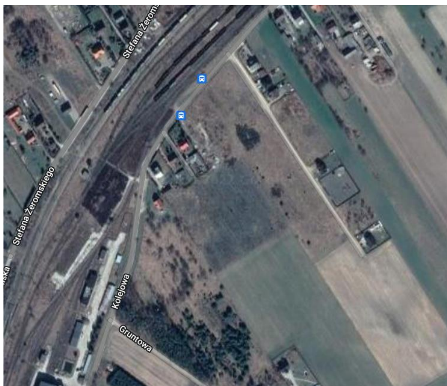
Ryc. 1 Fragment ortofotomapy dla miejscowości Ostrołęka

Wśród głównych celów prognozy oddziaływania na środowisko wskazać należy określenie skutków działań związanych ze zmianą sposobu zagospodarowania terenu, wpływu zmian na całokształt środowiska oraz jego poszczególne składowe, a także wpływ zmian na warunki życia i zdrowia ludzi. Prognoza ma za zadanie ułatwiać identyfikację przewidywanych skutków środowiskowych spowodowanych realizacją planu, a także dokonywać oceny, czy przyjęte rozwiązania ochrony środowiska w sposób wystarczający zabezpieczą środowisko przyrodnicze przed powstawaniem konfliktów i zagrożeń.