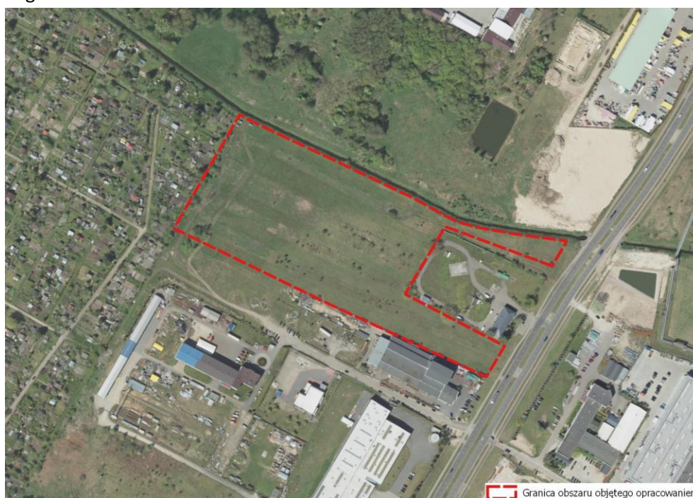
Ryc. 1 Fragment ortofotomapy dla miejscowości Ostrołęka z zaznaczoną granicą obszaru objętego opracowaniem

Wśród głównych celów prognozy oddziaływania na środowisko wskazać należy określenie skutków działań związanych ze zmianą sposobu zagospodarowania terenu, wpływu zmian na całość środowiska oraz jego poszczególne składowe, a także wpływ zmian na warunki życia i zdrowia ludzi. Prognoza ma za zadanie ułatwić identyfikację przewidywanych skutków środowiskowych spowodowanych realizacją planu, a także dokonywać oceny, czy przyjęte rozwiązania ochrony środowiska w sposób wystarczający zabezpieczą środowisko przyrodnicze przed powstawaniem konfliktów i zagrożeń.