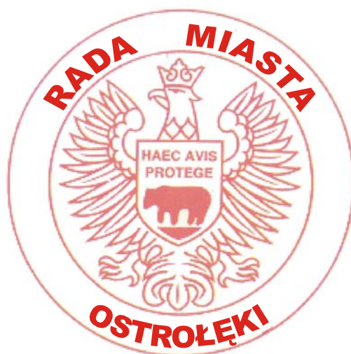
Pieczczę Rady Miasta Ostrołęki