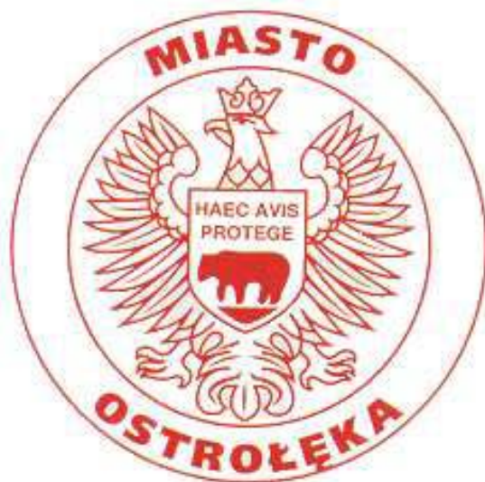
Pieczczę miasta Ostrołęki