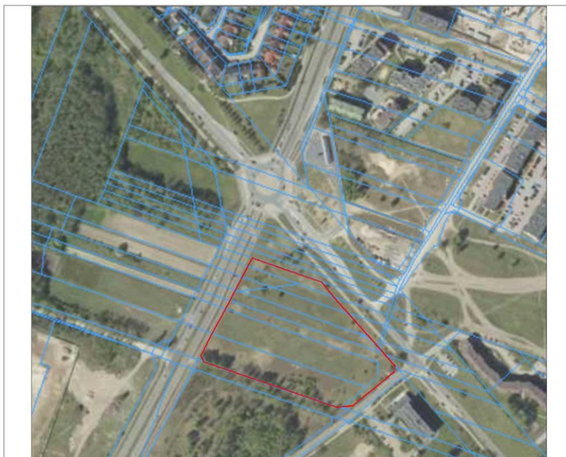
Ryc. 1 Fragment ortofotomapy dla miejscowości Ostrołęka z zaznaczoną granicą obszaru objętego opracowaniem

Wśród głównych celów prognozy oddziaływania na środowisko wskazać należy określenie skutków działań związanych ze zmianą sposobu zagospodarowania terenu, wpływu zmian na całokształt środowiska oraz jego poszczególne składowe, a także wpływ zmian na warunki życia i zdrowia ludzi. Prognoza ma za zadanie ułatwiać identyfikację przewidywanych skutków środowiskowych spowodowanych realizacją planu, a także dokonywać oceny, czy przyjęte rozwiązania ochrony środowiska w sposób wystarczający zabezpieczą środowisko przyrodnicze przed powstawaniem konfliktów i zagrożeń.