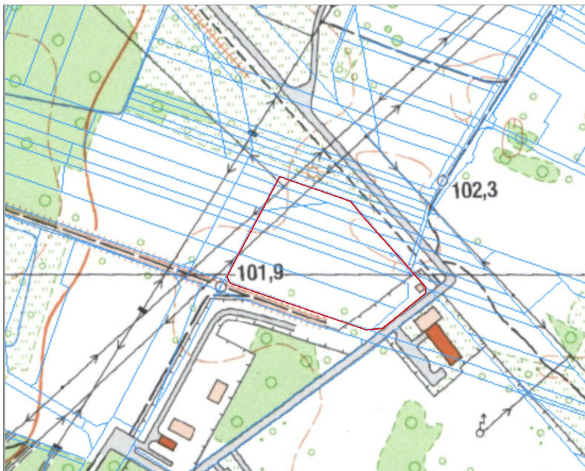
Ryc. 2 Fragment mapy topograficznej dla miejscowości Ostrołęka z zaznaczoną granicą obszaru objętego opracowaniem