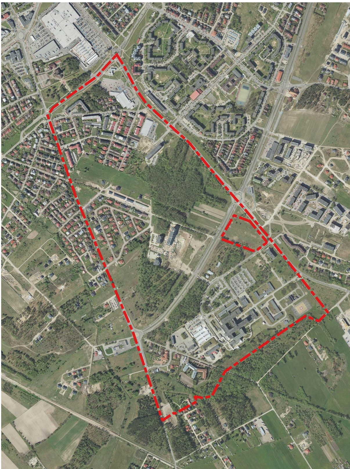
Ryc. 1 Fragment ortofotomapy dla miejscowości Ostrołęka z zaznaczoną granicą obszaru objętego opracowaniem