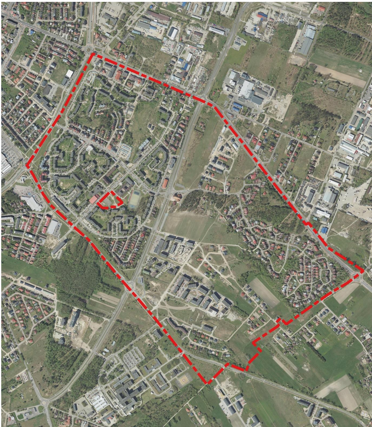
Ryc. 1 Fragment ortofotomapy dla miejscowości Ostrołęka z zaznaczoną granicą obszaru objętego opracowaniem

działań związanych ze zmianą sposobu zagospodarowania terenu, wpływu zmian na całokształt środowiska oraz jego poszczególne składowe, a także wpływu zmian na warunki życia i zdrowia ludzi. Prognoza ma za zadanie ułatwiać identyfikację przewidywanych skutków środowiskowych spowodowanych realizacją planu, a także dokonywać oceny, czy przyjęte rozwiązania ochrony środowiska w sposób wystarczający zabezpieczą środowisko przyrodnicze przed powstawaniem konfliktów i zagrożeń.