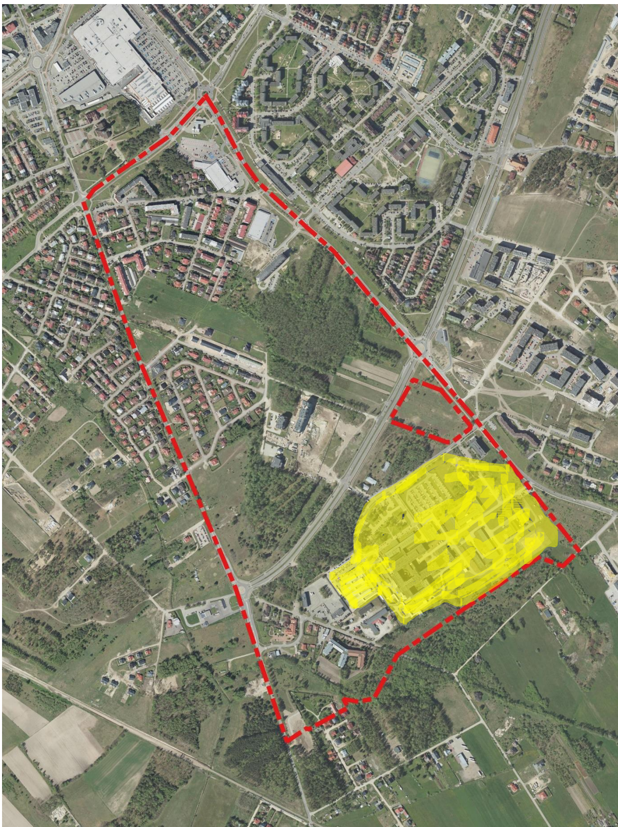
Ryc. 1 Fragment ortofotomapy dla miejscowości Ostrołęka z zaznaczoną granicą obszaru objętego opracowaniem (etap II oznaczony kolorem czerwonym – w części południowo wschodniej obejmujący etap III – obszar oznaczony barwą żółtą)