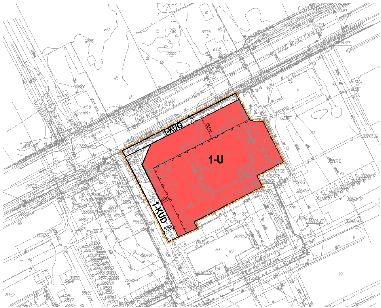
Rys. nr 4 - Wycinek z rysunku projektu Miejscowego Planu Zagospodarowania Przestrzennego rejonu „Partyzantów” w Ostrołęce.