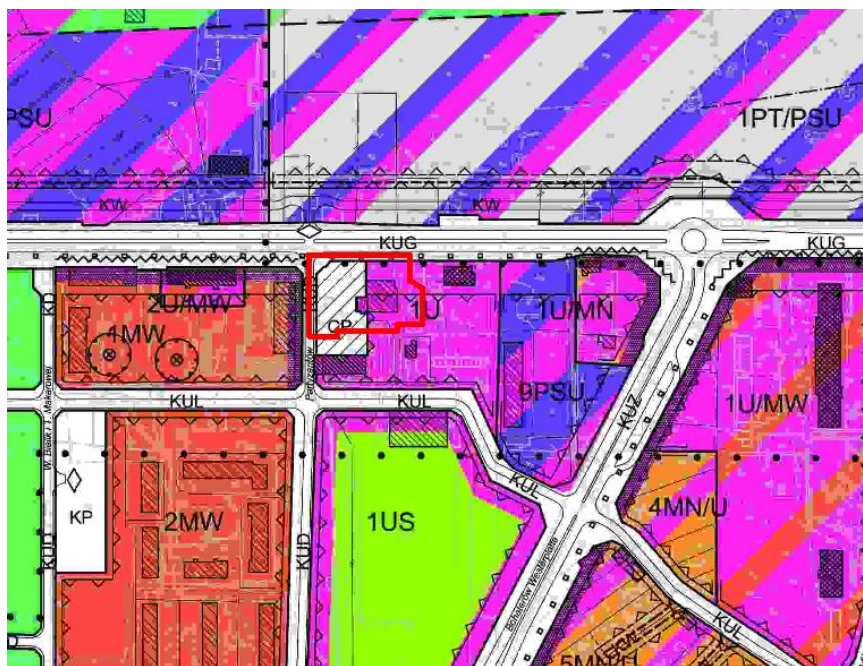
Rys. nr 1. Wycinek z rysunku obowiązującego planu miejscowego p.n. „Zmiany miejscowego planu zagospodarowania przestrzennego Miasta Ostrołęki w zakresie jednostek strukturalnych: B1 I, B1 II i B3 II (część północna) - rejon WOJCIECHOWICE.